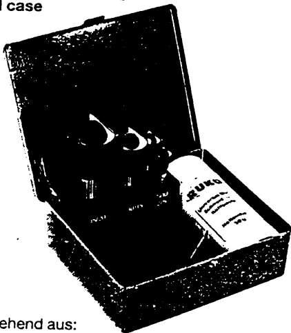
Kegel- und Entgratsenker mit Querloch 90° in Stahlblechkassette Slotted taper and deburring countersinkers 90° in steel case

Set 90° bestehend aus: je 1 Stck. Nenn-Ø 2/5 – 5/10 – 10/15 – 15/20 + 1 Schneidpaste