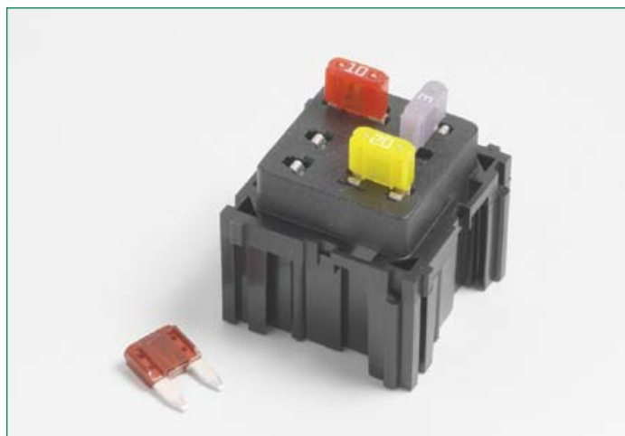
Dimensions in mm / Maße in mm