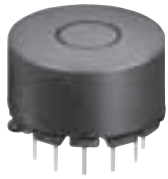
DIMENSIONS (mm) 外形寸法図

Drum-Pot type inexpensive inverter transformer using nickel core. ニッケルコア材を使用したドラム/ポットコア構造による廉価版インバータトランス。